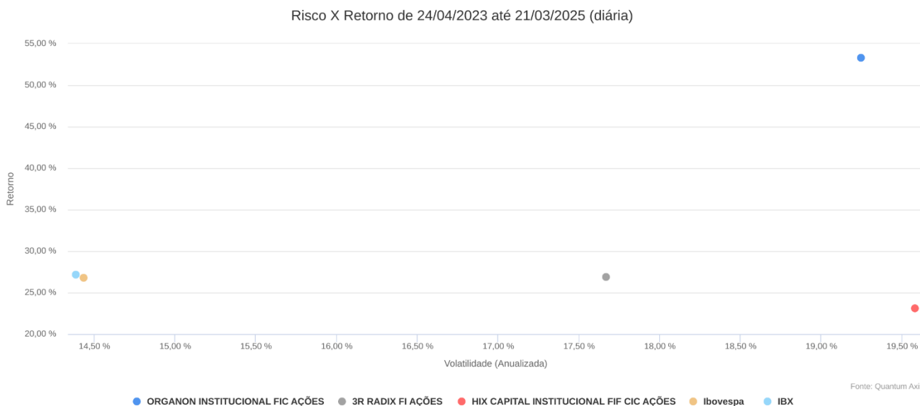
Figura 3: Correlação entre fundos Organon Inst FIC FIA, 3R Radix FIA e HIX Inst FIA